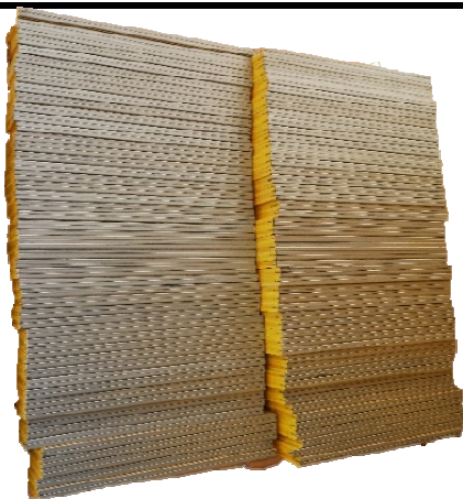
Perdangos plokštės rūšiuojamos pagal ilgius.