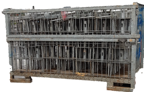
Keturšakės galvos dedamos į sandėliavimo dėžes 7x5 vnt, dėžėje 140vnt.