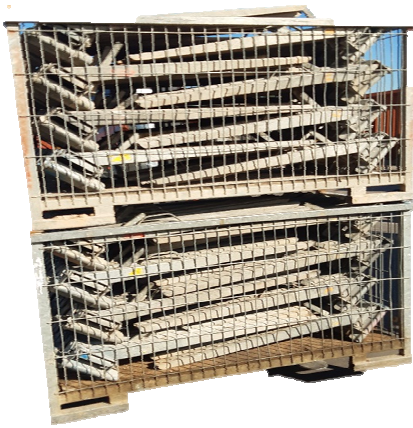
Trikojai dedami į sandėliavimo dėžes po 40vnt.